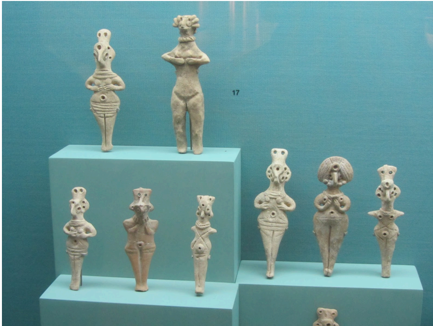
考古发现「家中的神像」