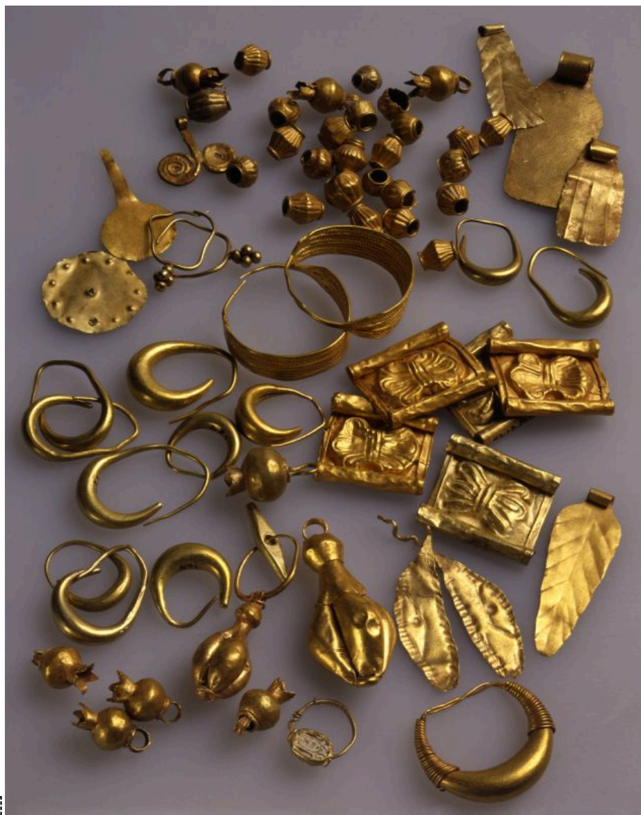
上图: 主前13世纪的以色列金首饰。现藏于耶路撒冷以色列博物馆 (Israel Museum)。

一「舍客勒」大约是11.4克, 「半舍客勒」的金鼻环重5.7克, 「十舍客勒」的金手镯大约每个重57克。这些礼物的价值超过当时一个雇工一年的工资。